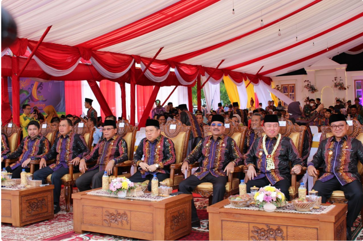
Tabalong. Diselenggarakan di halaman pendopo bersinar, dengan tema "Kerja Bersama Wujudkan Tabalong Sebagai Serambi Depan Kalimantan Selatan, Penyangga Ibu Kota Negara", peringatan hari jadi ke 57 Kabupaten Tabalong Kalsel digelar meriah, Selasa (6/12/2022).